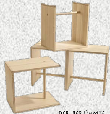
DER BERÜHMTE «ULMER-HOCKER»

1936 DEFINIERT ER IN EINEM AUSSTELLUNGSKATALOG DES KUNSTHAUSES ZÜRICH SEINE VORSTELLUNG VON «KONKRETER KUNST» UND WURDE ZU EINEM IHRER WICHTIGSTEN VERTRÉTER IN DER ZÜRCHER SCHULE DER KONKRETEN – EINER VON DER KUNSTGEWERBESCHULE ZÜRICH AUSGEHENDEN KUNSTSTRÖMUNG DER MALEREI – SOWIE DER DAVON INSPIRIERTEN, 1937 GEGRÜNDETEN VEREINIGUNG MODERNER SCHWEIZER KÜNST- LER – ALLIANZ.